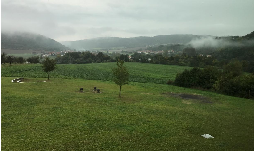
Vue depuis l'Arche Nebra.

Le 26 septembre, excursion en Saxe-Anhalt sur les traces du poète romantique allemand Novalis et de Luther – dont on célèbre le 500 ème anniversaire.