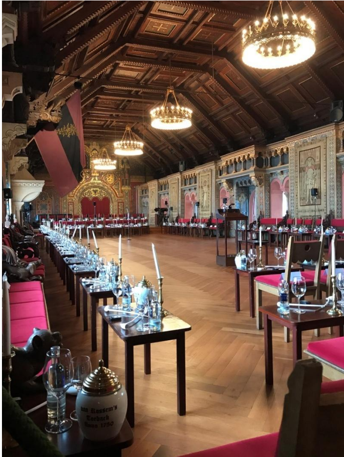
Grande salle d'apparat au dernier étage de la Wartburg, prête pour le tournage d'un film.