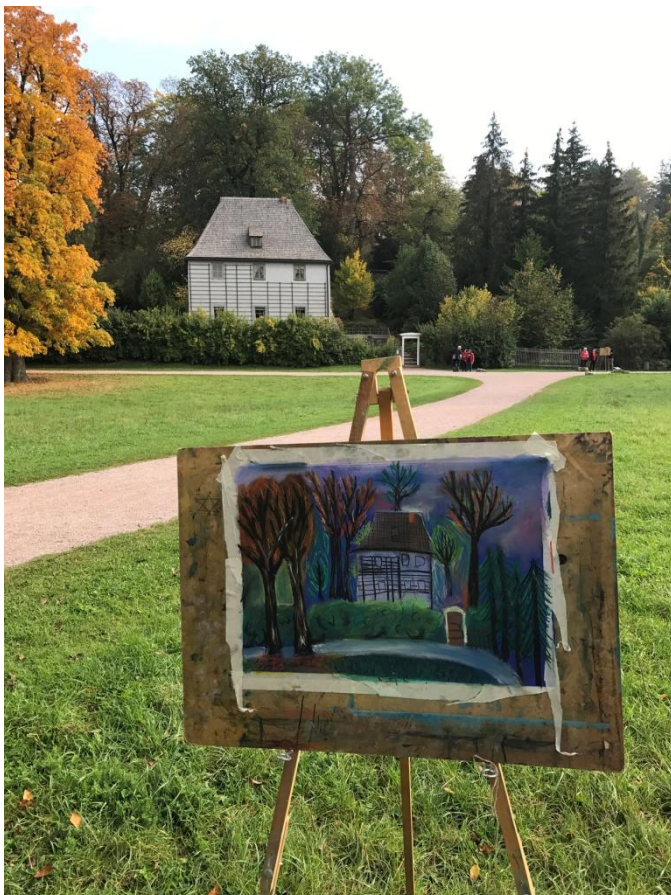
La maison des champs de Goethe, dans le parc de Weimar. Au premier plan la réalisation d'une élève des Beaux-arts.