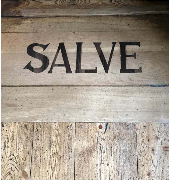
Le seuil de la maison de Goethe, désormais l'un des plus célèbres musée de l'Allemagne.

Weimar : la journée du 27 septembre est consacrée à la visite de la ville de Goethe et de Schiller.