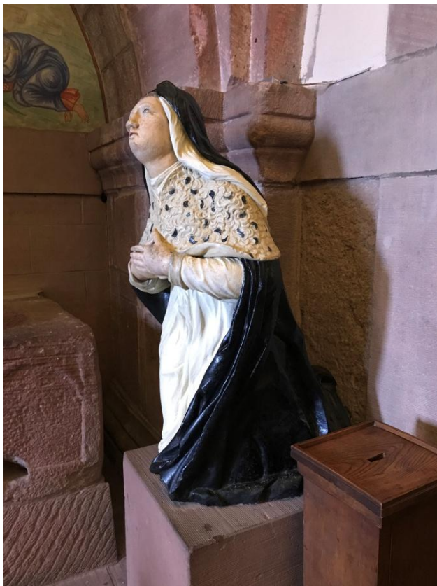
Statue de Sainte-Odile.

Une autre étape d'importance reste le Mont Saint-Odile, haut-lieu alsacien, et un sanctuaire dont la renommée demeure depuis l'an 720 – jubilé en l'année 2020.