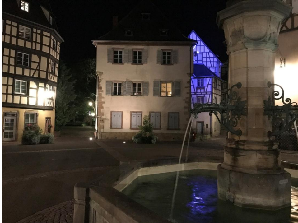
La vieille ville de Colmar, la nuit.

Une autre étape d'importance reste le Mont Saint-Odile, haut-lieu alsacien, et un sanctuaire dont la renommée demeure depuis l'an 720 – jubilé en l'année 2020.