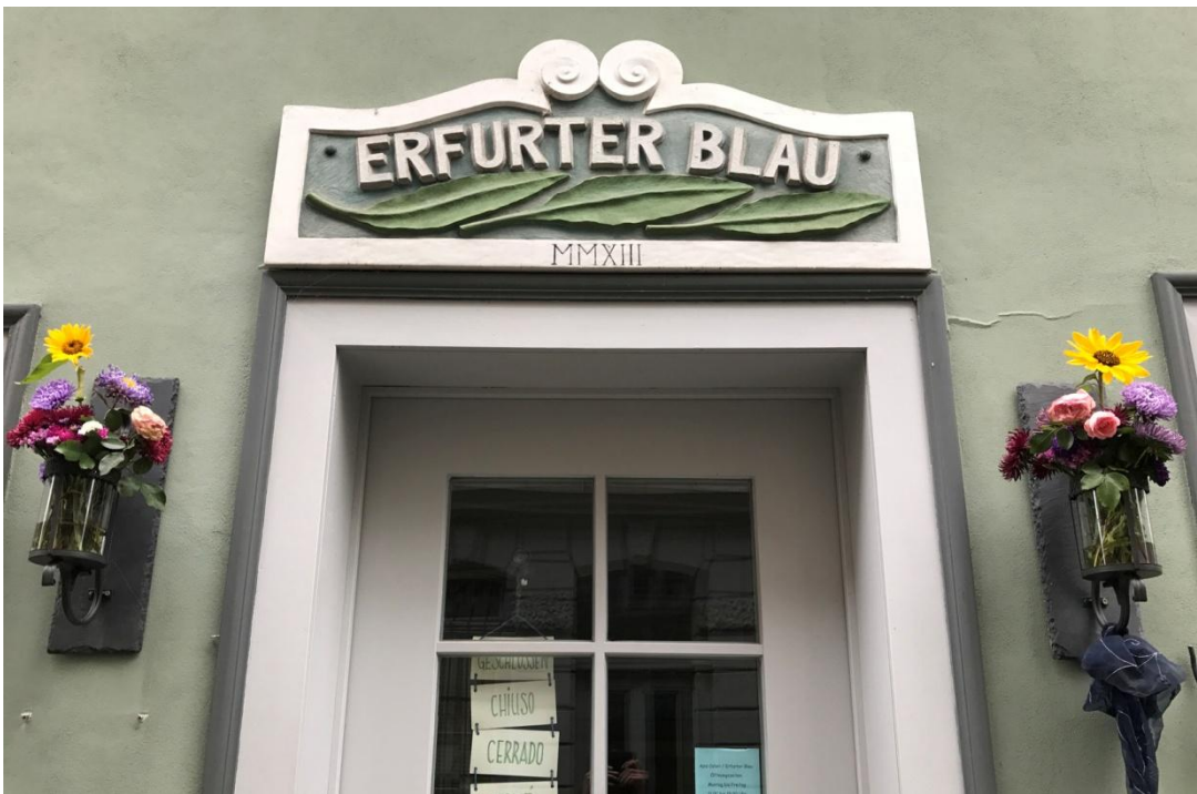
Erfurt, sur le Krämerbrücke.

Roßleben, petite ville de quelque 5000 habitants, est surtout connue pour son école, la Klosterschule qui nous accueille. Elle conserve encore de nombreux vestiges de la DDR.