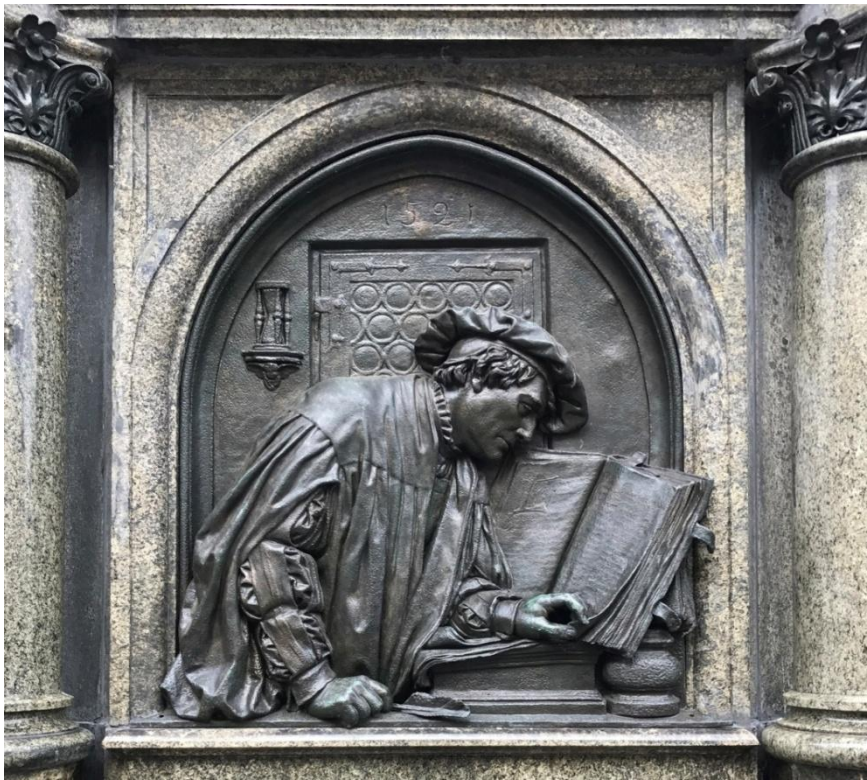
Dans l'après-midi, visite d'Eisleben, ville où le grand Réformateur, Luther, est né en 1483 et où il est mort en 1546.