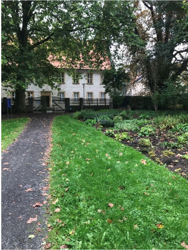
Novalis-Museum à Oberwiedersedt.