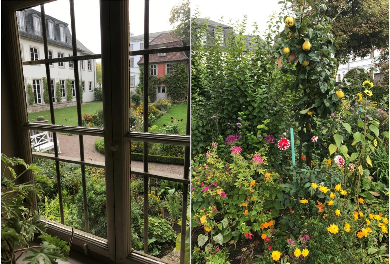
Le jardin de la maison de ville de Goethe.