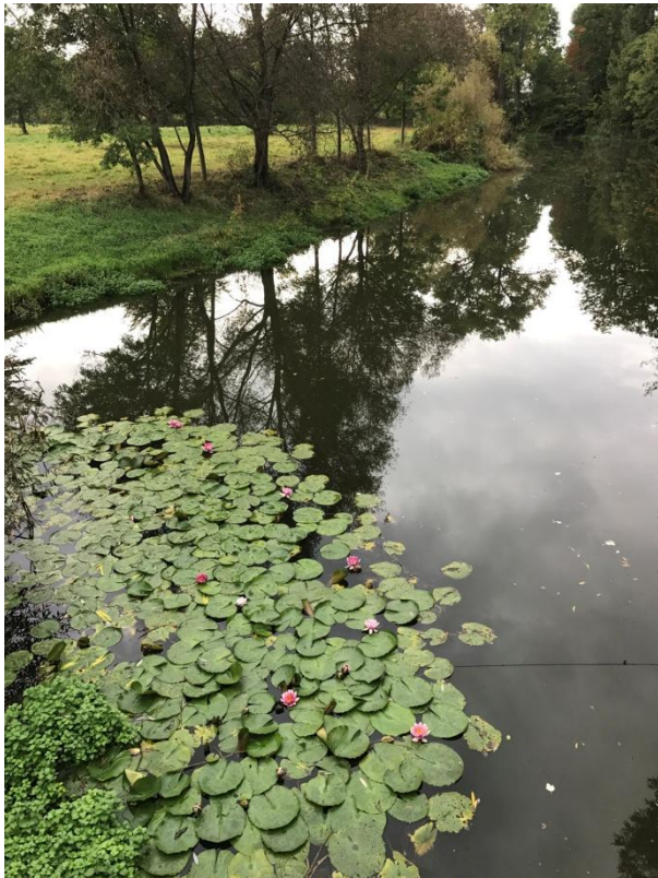
Un bras mort en bordure de la Klosterschule.

La nature environnante ne manque pas de charme, grâce à l'Unstrut, la principale rivière de Thuringe (avec la Saale).