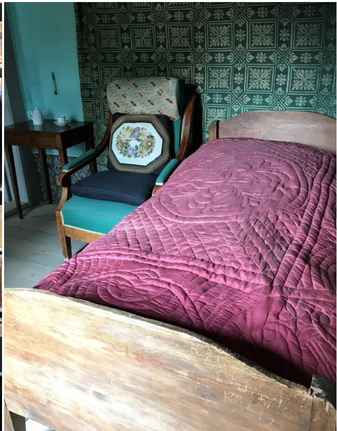
La chambre où Goethe est mort, le 22 mars 1832.