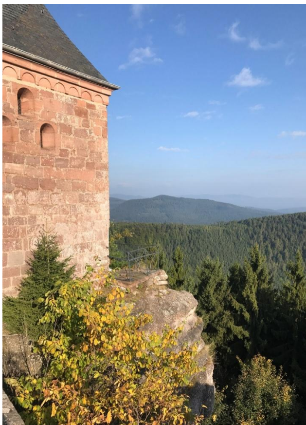
Depuis l'esplanade, la vue s'étend sur les Vosges du Nord, mais aussi, vers l'Est, sur la plaine d'Alsace, le Rhin et la Forêt Noire.

En Thuringe : arrivée à la Klosterschule, le 23 septembre. Notre délégation est invitée à participer à la cérémonie : 200 Jahre Abitur an der Klosterschule . Le lendemain, 24 septembre, excursion à Erfurt, capitale du Land de Thuringe.