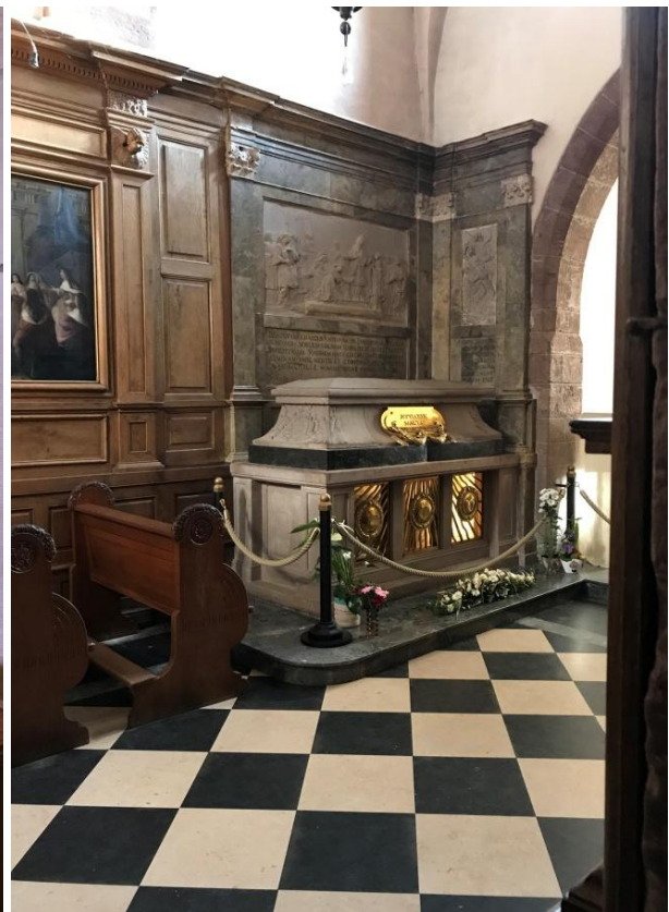
La tombe de Sainte-Odile, 8 ème siècle.