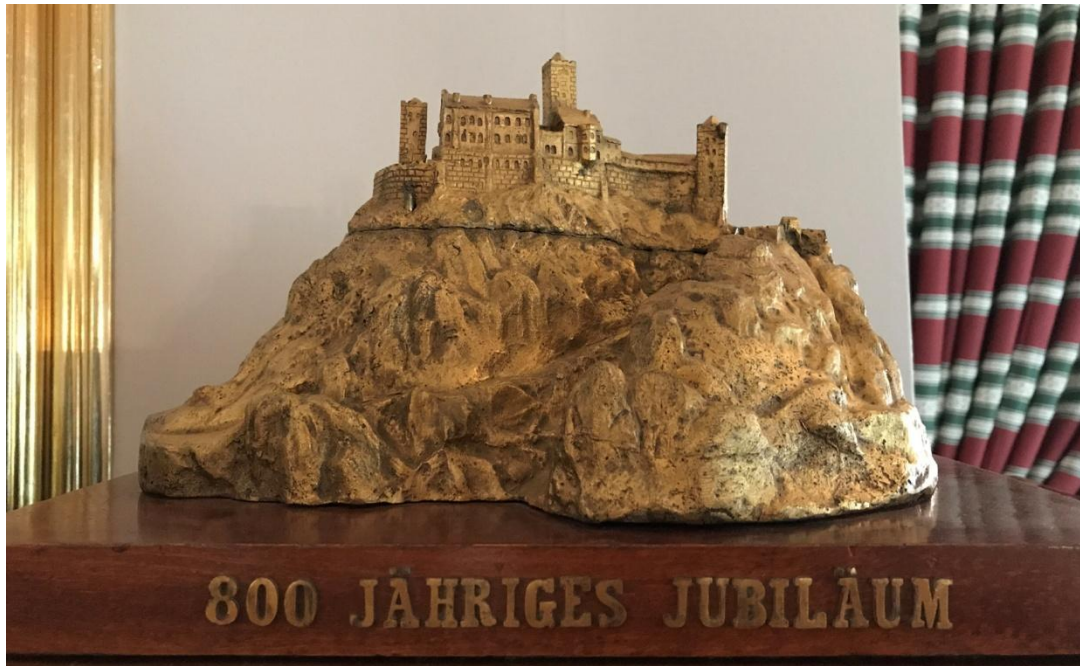
Dans la maison de Liszt à Weimar, pièce commémorative pour le jubilé de la Wartburg, le 18 août 1867.

Jeudi 28 septembre, excursion au château de la Wartburg (Eisenach, Thuringe), sans doute un des lieux les plus chargés d'histoire de toute l'Allemagne, des Minnesangers du moyen-âge à sainte Élisabeth de Hongrie, et Luther, de Novalis à Wagner et Liszt.