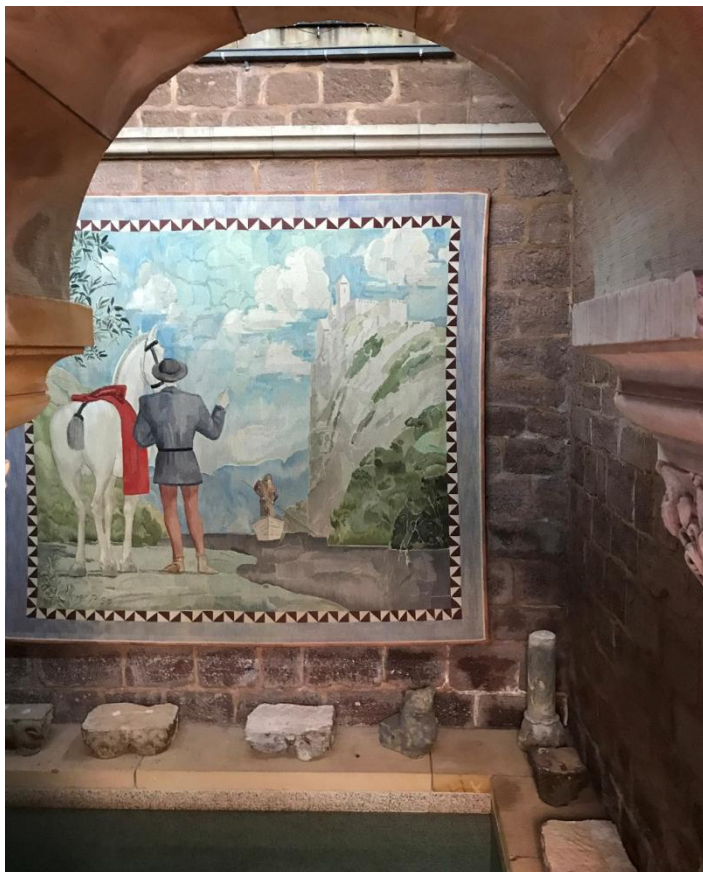
Vision romantique de la Wartburg.

Jeudi 28 septembre, excursion au château de la Wartburg (Eisenach, Thuringe), sans doute un des lieux les plus chargés d'histoire de toute l'Allemagne, des Minnesangers du moyen-âge à sainte Élisabeth de Hongrie, et Luther, de Novalis à Wagner et Liszt.