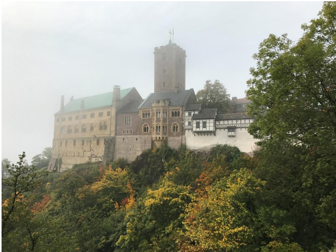
Notre Wartburg, vue dans le brouillard matinal et les couleurs de l'automne.