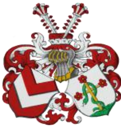
Les armes de la Klosterschule