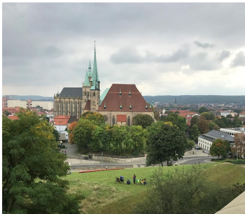
Erfurt, vue depuis la forteresse.

En Thuringe : arrivée à la Klosterschule, le 23 septembre. Notre délégation est invitée à participer à la cérémonie : 200 Jahre Abitur an der Klosterschule . Le lendemain, 24 septembre, excursion à Erfurt, capitale du Land de Thuringe.