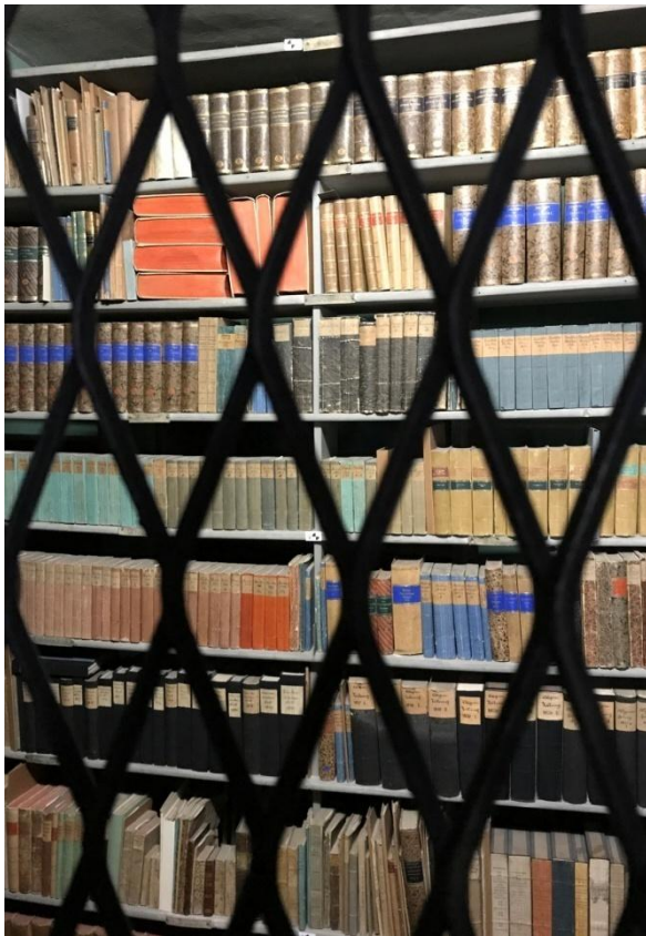
Une partie de la bibliothèque du grand homme.