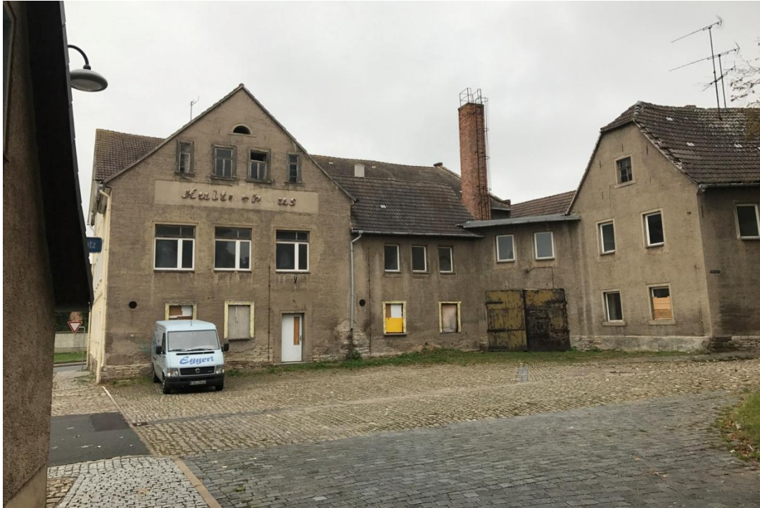
L'ancienne « Maison de la Culture ».

La nature environnante ne manque pas de charme, grâce à l'Unstrut, la principale rivière de Thuringe (avec la Saale).