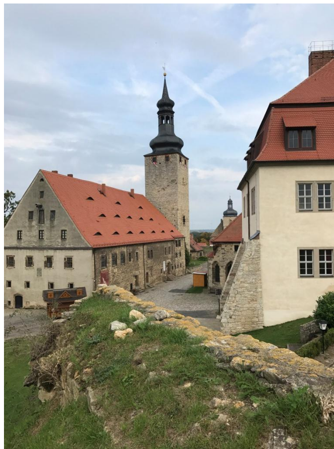
Querfurt, à l'intérieur du château médiéval.

De retour à Roßleben, une halte pour visiter la ville historique de Querfurt.